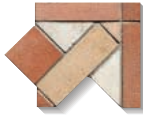
Angolo 15x15 - 6"x6"

gradino 30x30 step tread 30x30 - 12"x12" nez de marche 30x30 Stufenplatte 30x30 peldaño 30x30