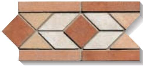
Fascia 15x30 - 6"x12"

pezzi speciali - trims - piècés speciales - Formteile - piezas especiales